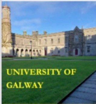
UNIVERSITY OF GALWAY